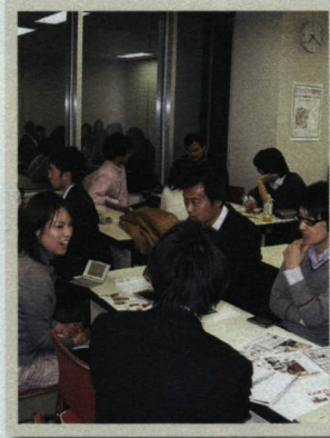
編集者〇のつぶやき

金曜19時～20時45分、東京ウィメンズプラザ(東京都渋谷区)での会に参加。まず2人1組で、1人1分ずつ、決まったトピックで話す。その後、ゲームなどしながら話し続け、あっという間に約2時間が経った。