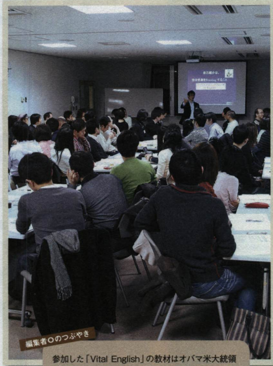
編集者〇のつぶやき

参加した「Vital English」の教材はオバマ米大統領の英語。参加者約100人。参加者同士の自己紹介から始まった。「勉強会中、かなりの英語を話すので1000円はすぐ元が取れる」(参加者)。