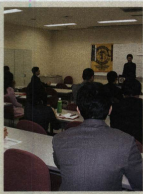
編集者〇のつぶやき

人のスピーチを聞いて、「ここが良かった」とまず褒めるのが印象的。会全体が明るく前向きで、すぐになじめた。会の進行もただ滞りなく進めるのではなく、笑いを取ったり、個性溢れるスピーチを挟んだりしていた。